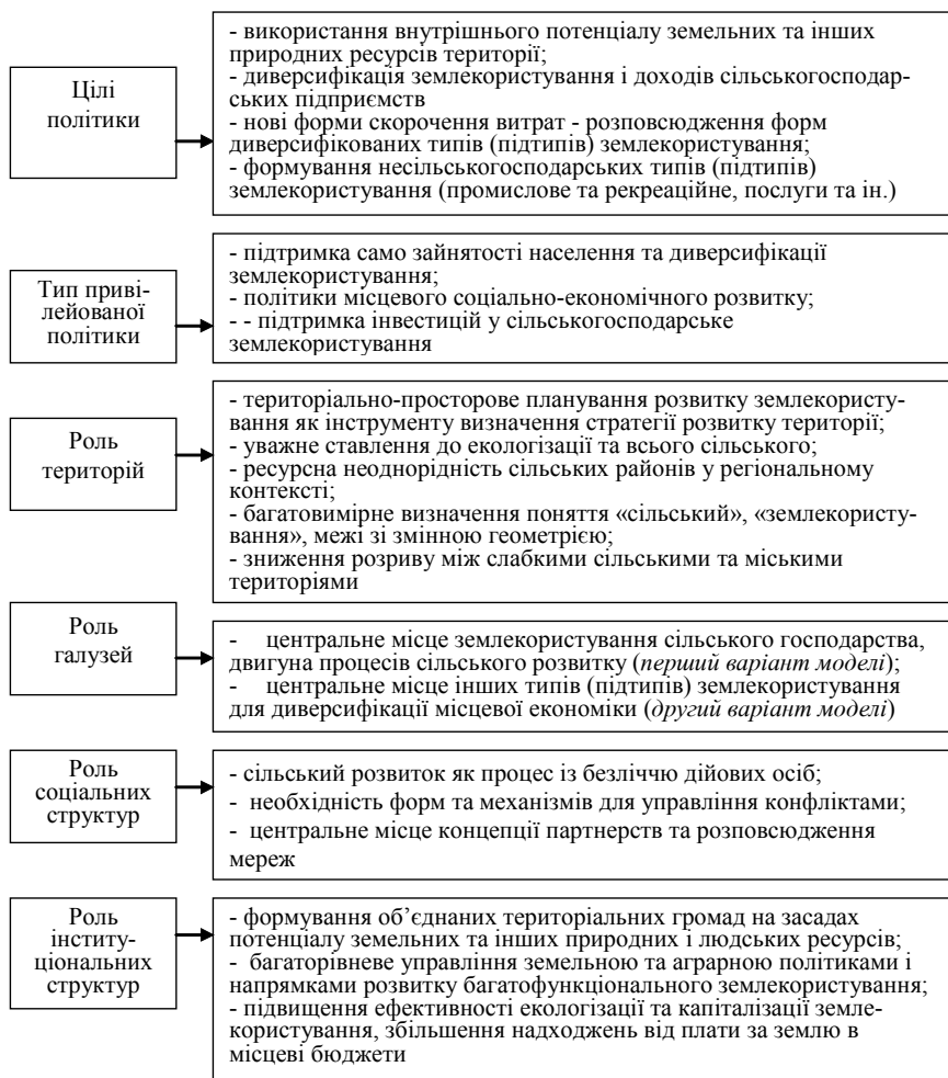
Рис. 2. Основні характеристики територіально-просторової моделі функціонування земельного устрою сільських територій