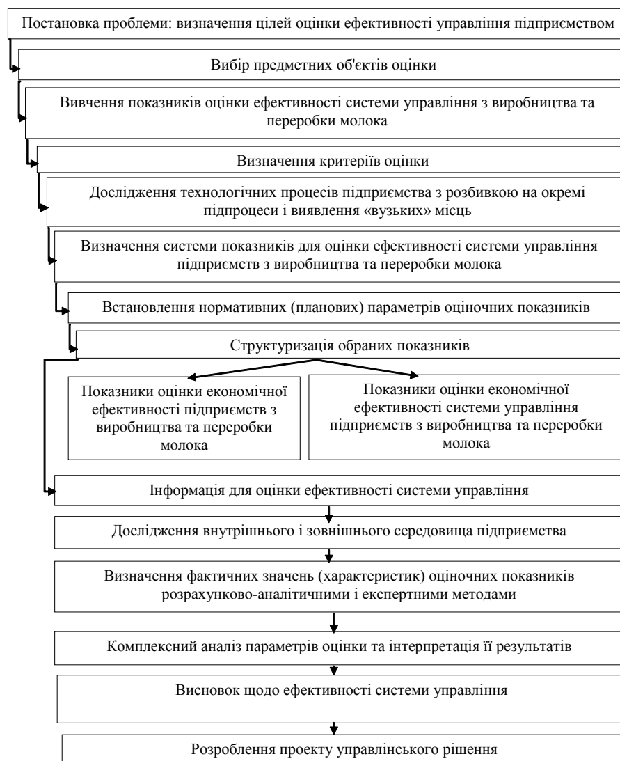
Рис. 1. Основні етапи оцінки економічної ефективності системи управління молокопродуктового підкомплексу