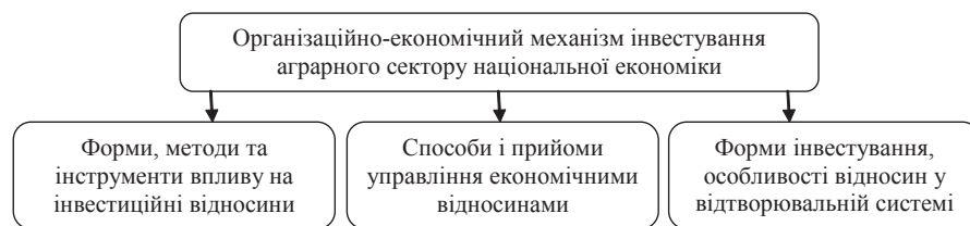
Рис. 1. Складові організаційно-економічного механізму інвестування аграрного сектору