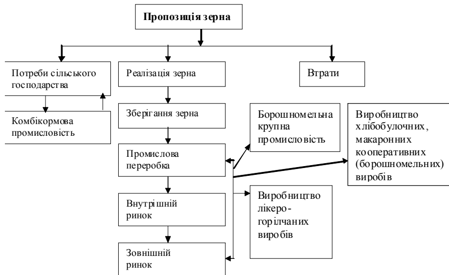
Рис.3. Загальна схема руху зерна і продуктів його переробки у Вінницькій області

тово-регіонального комплексу забезпечить створення кластера як групи підприємств, які об'єднані на добровільній основі та підтримують один одного, завдяки територіальній концентрації зернового виробництва та випуску продукції його переробки, мережі спеціалізованих постачальників і споживачів, пов'язаних між собою технологічним ланцюгом. Територіальне розташування Вінницької області сприяє формуванню кластерів, зокрема в зернопродуктовому виробництві, які повинні мати чіткі межі [1, с. 125].