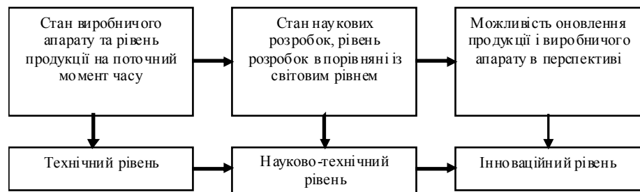
Рис. 2. Взаємозв'язок технічного, науково-технічного і інноваційного рівнів розвитку

Зерно, зібране з полів області, спочатку реалізується на внутрішньому ринку, після чого знаходить на зовнішній ринок, причому втрачається значна частина доходів сільгоспвиробників. Це зумовлює доцільність створення великої єдиної компанії, яка зможе формувати достатньо великі партії зерна для виходу на зовнішній ринок, бо окремі сільгоспвиробники забезпечити цей процес не в змозі. Ці функції може виконувати збутовий кооператив, який може бути створений за участі