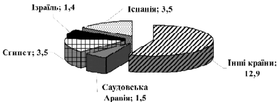
Рис. 2. Експорт зернових у розрізі країн світу 2012/13 МР, млн т

У 2012/13 МР з України було вивезено 22,85 млн т зернових, що на 1,26 млн т (5,8%) більше ніж в попередньому сезоні. В тому