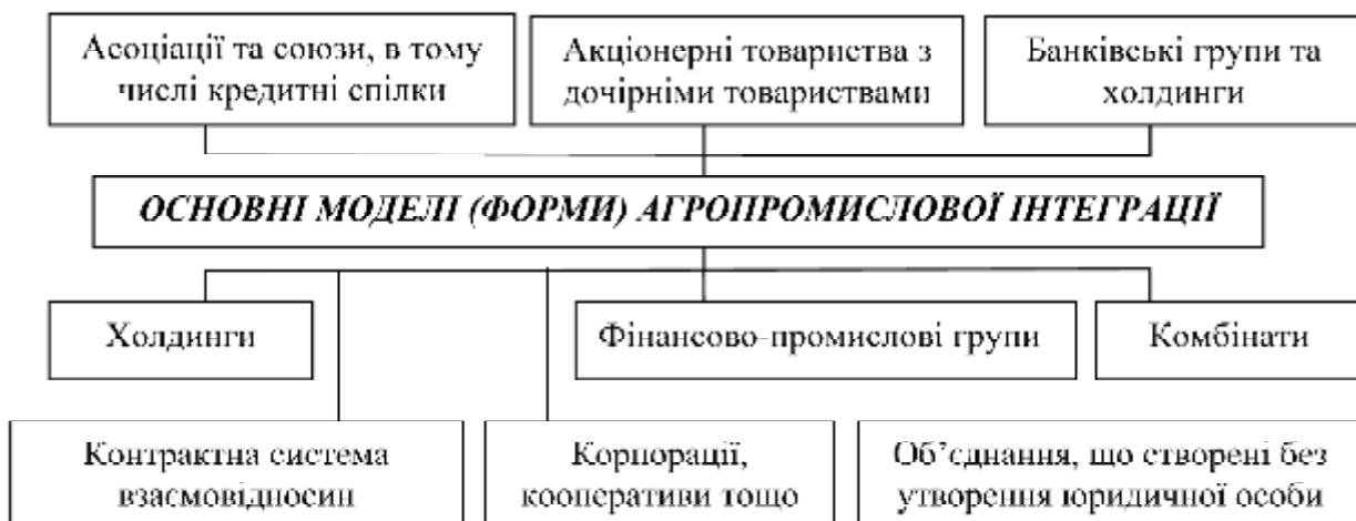
Рис. 2. Моделі агропромислової інтеграції

Фінансово-промислові групи як одна із форм інтегрованих об'єднань, являють собою інтеграцію виробничих процесів, починаючи від наявності та забезпеченості сировиною і закінчуючи вивченням фінансового капіталу.