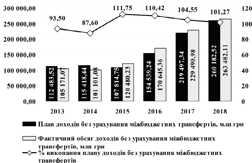
Рис. 1. Динаміка виконання плану доходів місцевих бюджетів України у 2013–2018 рр.

Від рівня наповнення бюджету згідно з планом доходів залежить ступінь виконання органами місцевого самоврядування покладених на них функцій та повноважень. У 2013 та 2014 роках плани загальної суми доходів місцевих бюджетів України, які становили 112483,52 млн грн та 115418,44 млн грн відповідно, не виконувалися в повному обсязі: відсоток виконання становив 93,5% та 87,6% відповідно. У наступні чотири роки забезпечено наповнення місцевих бюд-