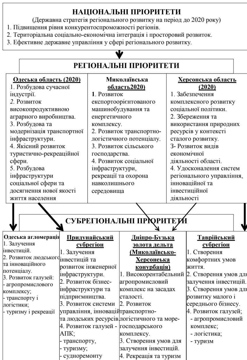
Рис. 3. Пріоритети регіонального розвитку в приморських регіонах та субрегіонах Українського Причорномор'я