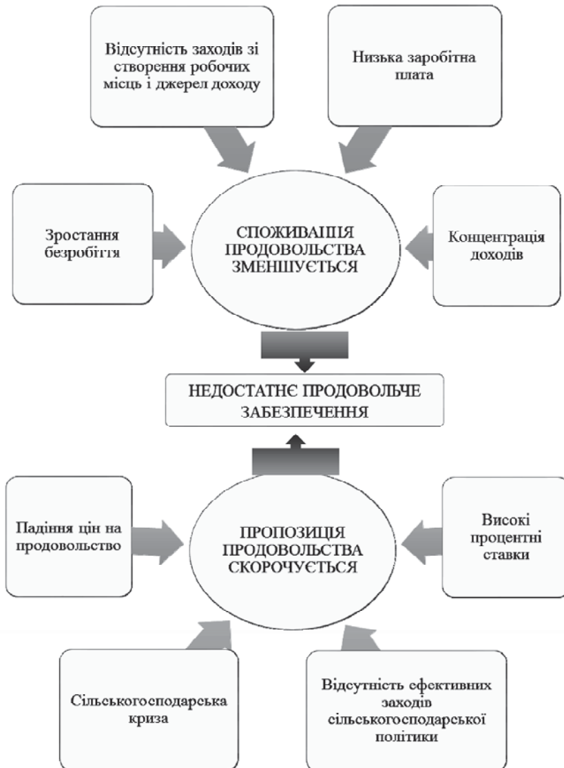
Рис. 1. Проблеми недостатнього продовольчого забезпечення в Україні