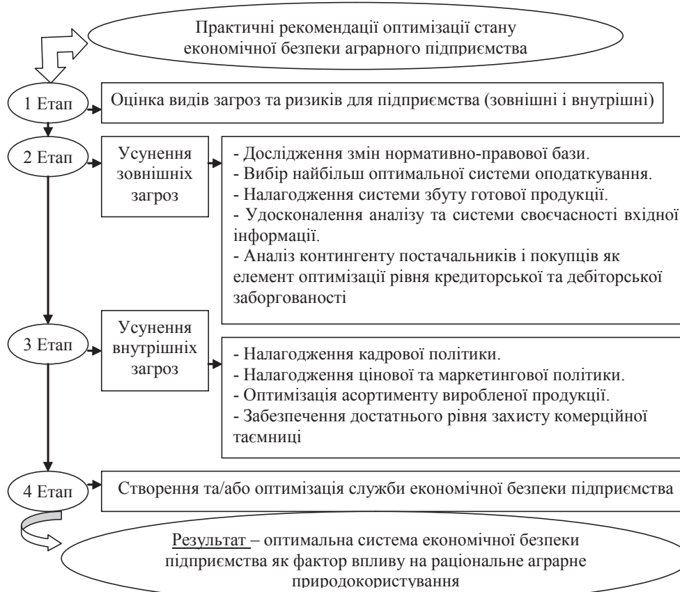
Рис. 2. Практичні рекомендації оптимізації стану економічної безпеки аграрного підприємства