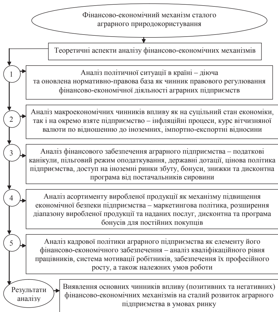
Рис. 1. Алгоритм впливу фінансово – економічного механізму на забезпечення сталого розвитку аграрного підприємства в умовах ринку