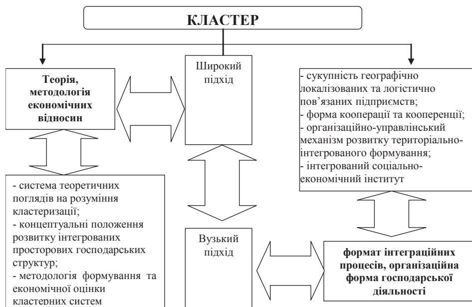
Рис. 1. Кластер як об'єкт наукового пізнання