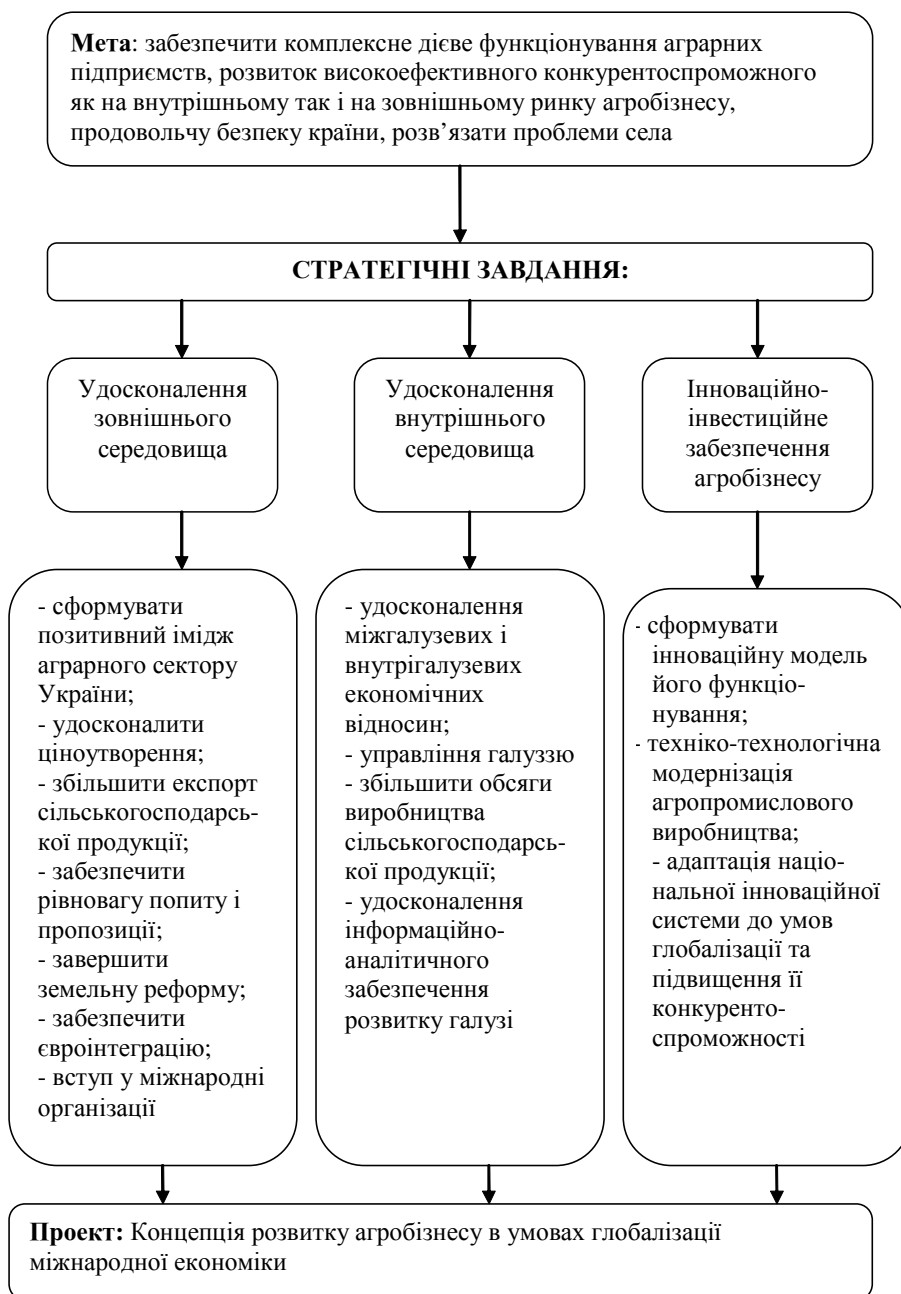
Рис. 4. Стратегія розвитку аграрних підприємств України в умовах глобалізації міжнародної економіки

З огляду на те, що в результаті аналізу бізнес-середовища суб'єктів агробізнесу України виявлено більше переваг, ніж недоліків, і вони є більш суттєвими, можна зробити висновок, що вони розвиваються в напрямі глобалізації світової економіки і для них відкриваються нові можливості при виході на міжнародний рівень. Аграрні підприємства повинні бути готові до майбутніх світових змін, які вимагають підвищення оперативної активності в умовах глобалізації, гнучкої, збалансованої стратегії, фінансової самостійності, позитивного сприйняття будь-яких змін і здатності активно реагувати