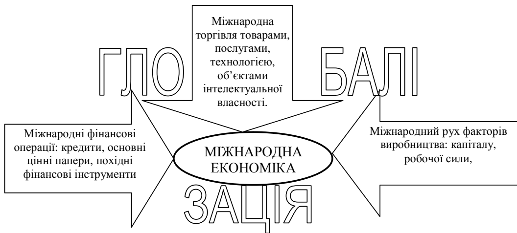
Рис. 2. Розвиток міжнародної економіки у зв'язку з глобалізаційними процесами

масштабах виробництва, що потенційно може сприяти зниженню цін; підвищення рівня продуктивності праці в результаті раціоналізації виробництва на глобальному рівні й поширення передових технологій, а також посилення конкурентного тиску на користь безперервного введення інновацій у світовому масштабі.