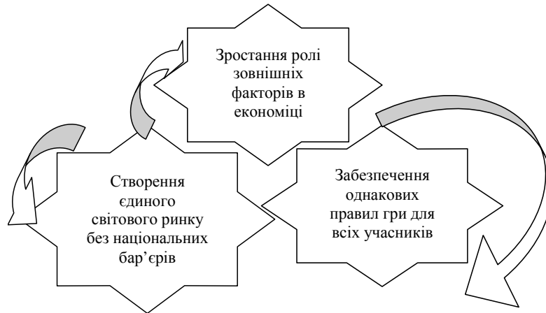
Рис. 1. Основні фактори економічного прояву глобалізації