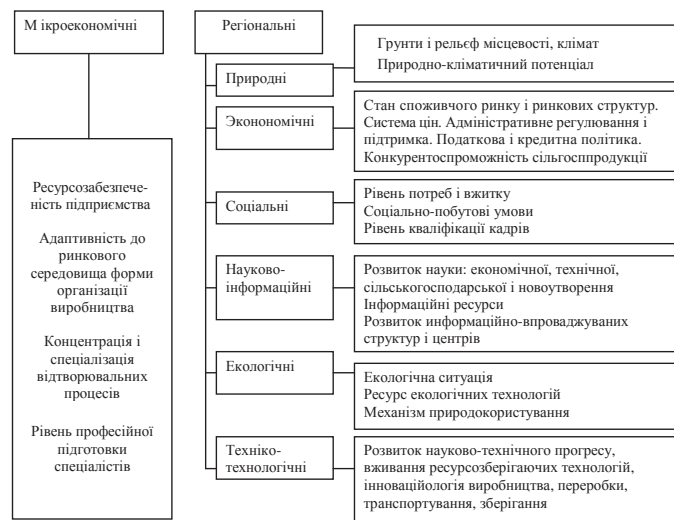
Рис. 1. Специфічні чинники, що визначають склад і структуру АПФГ

Для успішного функціонування агропромислових фінансових груп потрібне комплекс-