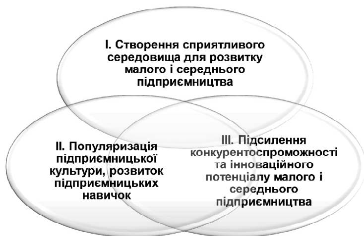
Рис. 2. Основні напрями розвитку малого і середнього підприємництва у сфері виробництва в Донецькій області

ню конкурентоспроможності продукції малих і середніх підприємств. Донецька торгово-промислова палата об'єднує понад 900 підприємств, або майже 9 % підприємств регіону залишається сучасною та авторитетною бізнес-інституцією та забезпечує активну підтримку виробничого підприємництва в області.