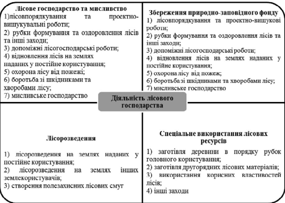
Рис. 4. Взаємоузгоджені головні напрями діяльності лісового господарства

Поняття суспільного інтересу є настільки багатограним та всеохоплюючим, що унеможливає його визначення в межах однієї дефініції. Із сутності поняття лісогосподарського підприємства як суб'єкта економіко-суспільного інтересу витікає наступне, що категорія "лісове господарство" може використовуватися в таких варіантах: як галузь — лісове господарство; як окреме підприємство; як ознака виробничого процесу, втіле-