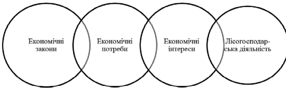
Рис. 3. Взаємозв'язок економічних законів з господарською діяльністю