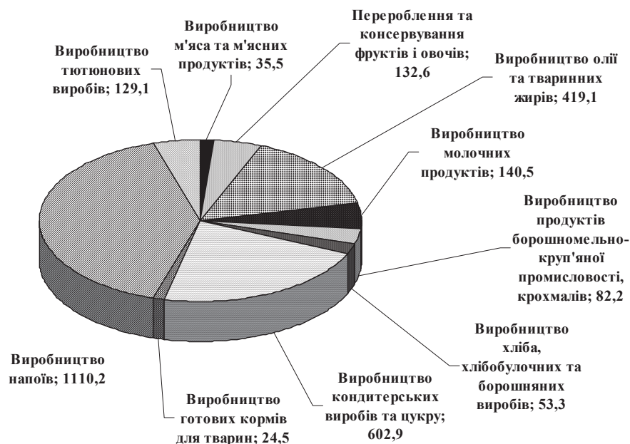
Рис. 2. Структура прямих іноземних інвестицій у харчову промисловість станом на 31.12.2014, млн дол. США