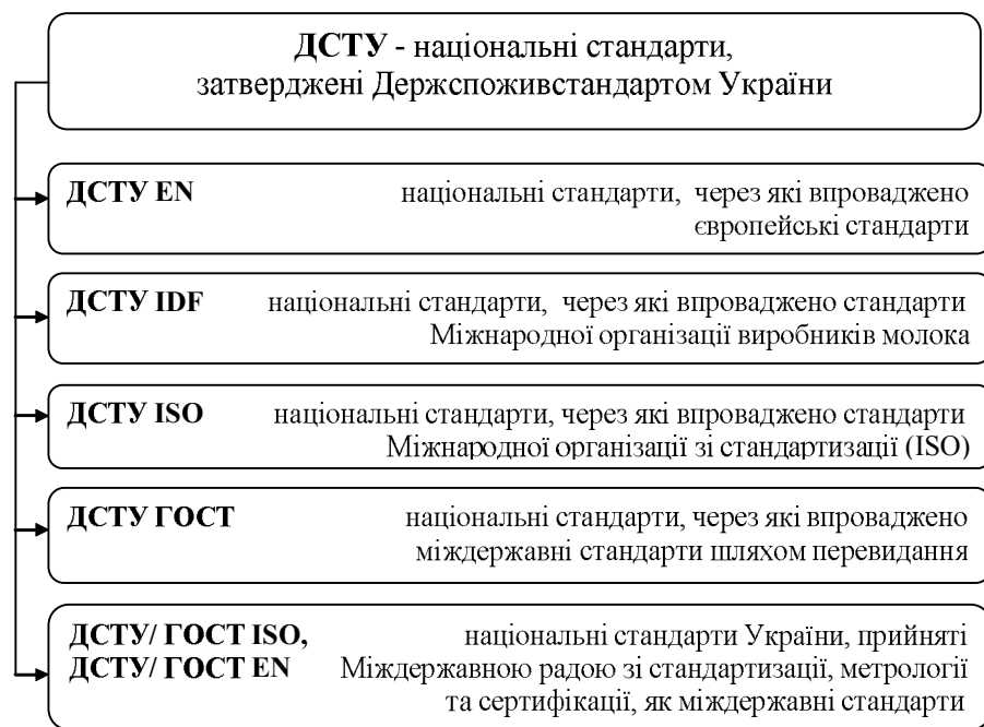
Рис. 2. Види національних стандартів України

попитом не лише у населення України, а й закордоном й відома такими торговими марками, як: "Яготинське", "Premiale", "КАГМА", "Ромол", "Слов'яночка", "Чудо", "Веселий молочник", "Фругурт", "Смач-ненька", "Олком", "На здоров'я", "Буренка", "Селянське", "Тотоша", "Кремез", "Гармонія" тощо.