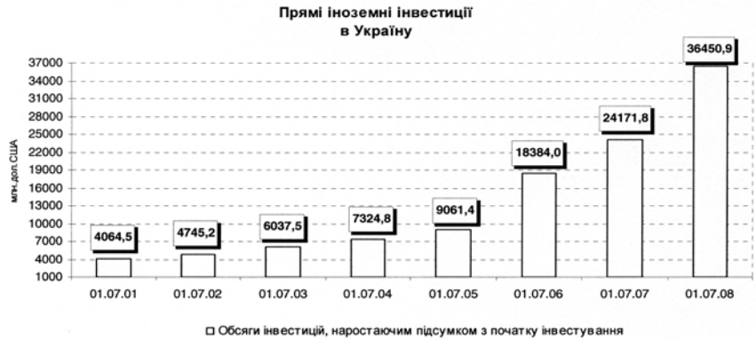
Рис. 1. Обсяг прямих іноземних інвестицій в Україну за період 2001—2008 рр.

Низька частка інвестицій, що офіційно надходять з країн США, сигналізує про незацікавленість