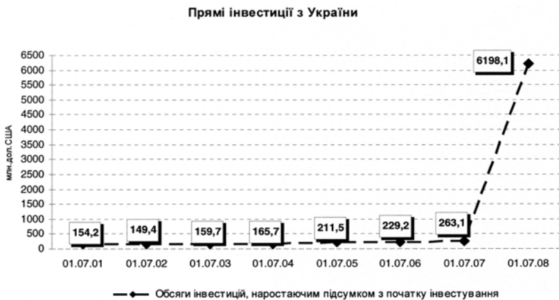
Рис. 3. Обсяг прямих іноземних інвестицій з України за період 2001—2008 рр.

Україною та ЄС базується на впровадженні Україною Стратегії інтеграції до ЄС, виконанні сторонами УПС та опрацюванні Плану дій (ПД) в рамках Європейської політики сусідства. Україна виходить з того, що реалізація зазначеного документа має сприяти посиленню співпраці між Україною та ЄС в умовах розширення, створити необхідні умови для переходу в майбутньому до якісно нового рівня відносин з ЄС. Належна імплементація ПД повинна також сприяти поступовій інтеграції України до внутрішнього ринку ЄС та створити передумови для започаткування з ЄС зони вільної торгівлі. Кінцевою політичною метою ПД має стати укладення нової посиленої угоди з ЄС.