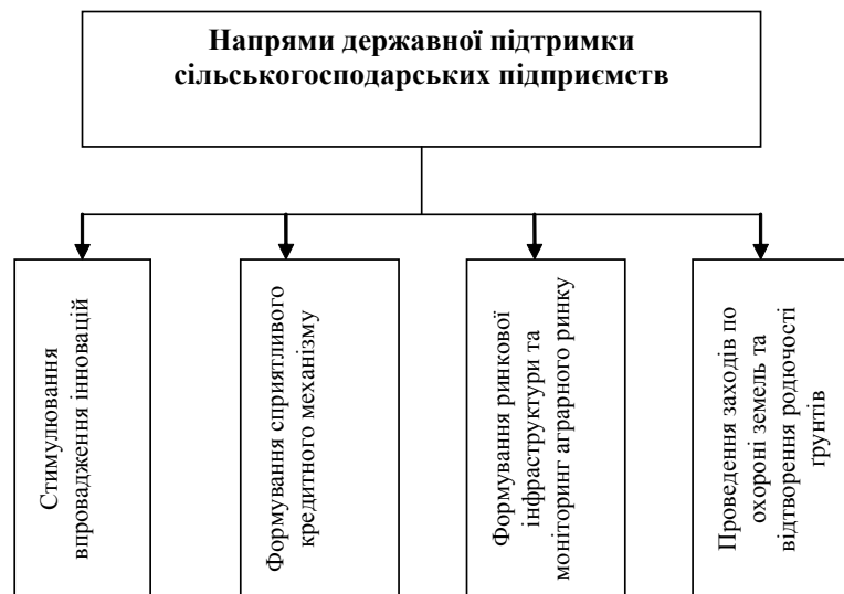
Рис. 3. Основні напрями державної підтримки сільськогосподарських підприємств

підприємствах, а не у сільськогосподарських товаровиробників; по-третє, додаткові доплати з бюджету отримують лише високорентабельні сільськогосподарські галузі, а інші цієї допомоги не отримують; по-четверте, більшість коштів у рослинництві та тваринництві не витрачається на підвищення ефективності селекційних заходів; по-п'яте, неефективна господарська діяльність більшості сільськогосподарських підприємств свідчить про низьку віддачу від вкладених бюджетних коштів. Тому нами пропонується виділити групу критеріїв, за якими повинна надаватися державна підтримка сільськогосподарських підприємств, яка б не суперечила правилам її надання згідно з вимогами СОТ: