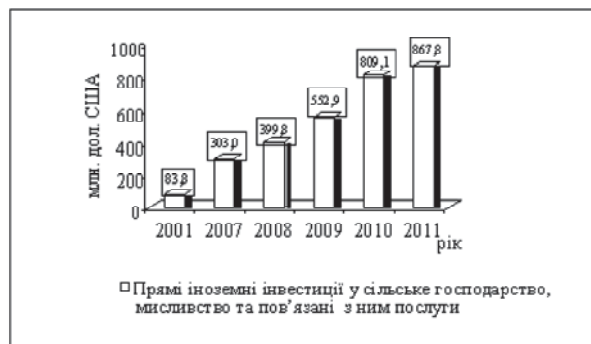
Рис. 2. Іноземні інвестиції в агропродовольчий сектор України

версифікації, зріс на 4 млрд грн. або 115 %. Амортизаційні фонди харчових підприємств практично не виконують свої функції як джерела інвестиційних ресурсів, що обумовлено, в основному, нецільовим використанням амортизаційних відрахувань та недосконалістю механізму їх здійснення, зокрема невідповідністю темпів індексації основних фондів та їх реальної вартості.