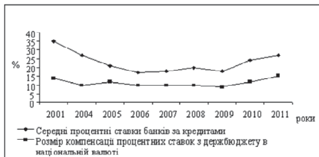
Рис. 1. Фінансові результати діяльності підприємств агропродовольчого сектору України