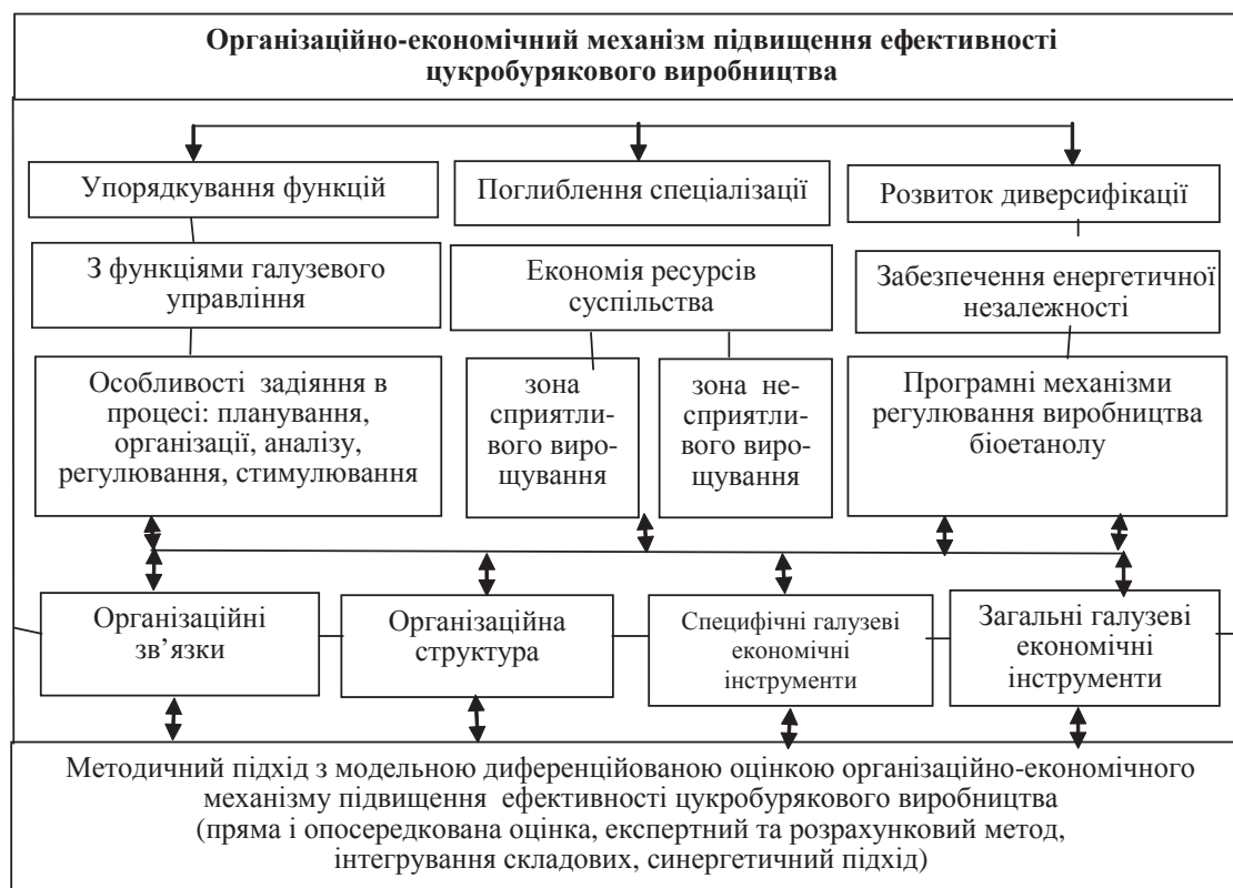
Рис. 2. Організаційно-економічний механізм підвищення ефективності цукробурякового виробництва