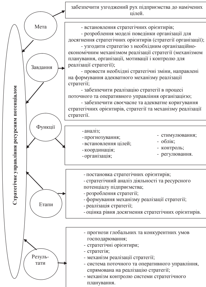
Рис. 2. Елементи стратегічного управління ресурсним потенціалом підприємства