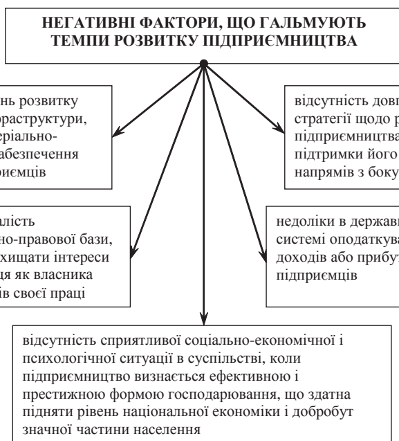
Рис. 1. Негативні фактори, що гальмують темпи розвитку підприємництва

— активізація інноваційно-інвестиційної діяльності на основі впровадження ресурсоо-