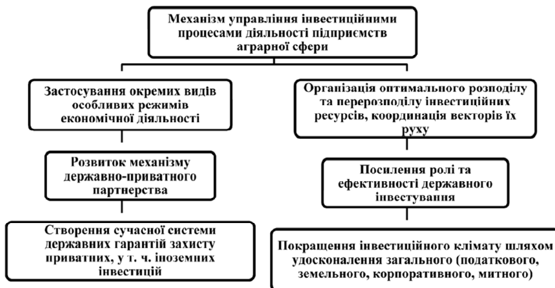
Рис. 1. Механізм управління інвестиційними процесами діяльності підприємств аграрної сфери