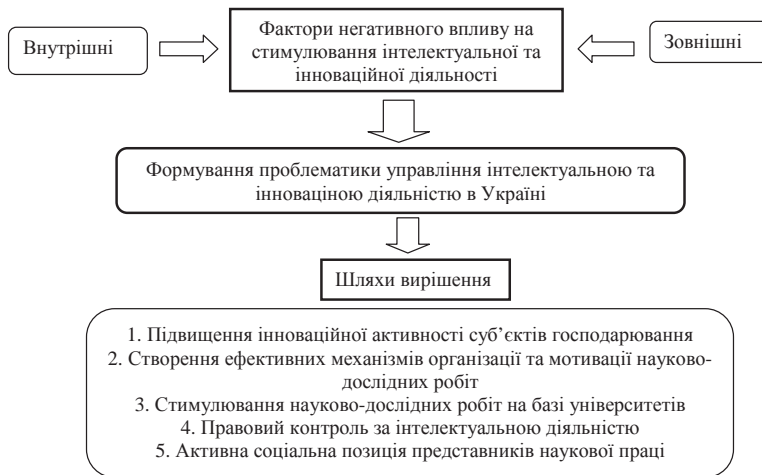
Рис. 2. Шляхи вирішення проблем інтелектуальної та інноваційної діяльності в Україні

сфері захисту інтелектуальної власності, не створила сприятливого середовища і необхідної інфраструктури щодо ефективного функціонування даного сектора. За рівнем захисту та забезпечення прав власності за підсумками 2006 року Україна посідає 58-ме місце. Про це свідчать результати дослідження "Міжнародний індекс прав власності", проведеного американською асоціацією "Альянс за права власності". При складанні рейтингу враховувалися такі показники: незамінність судової влади, довіра бізнесу до суддів, політична стабільність, корупція, законодавча захищеність приватної власності, зручність реєстрації та перереєстрації власності, а також питання захисту інтелектуальної власності. На перше місце у світі за рівнем захисту прав інтелектуальної власності за результатами досліджень поставлено Норвегію [9].