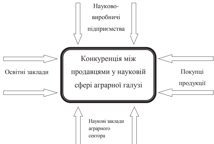
Рис. 2. П'ятифакторна модель конкурентних сил за М. Портером для наукоємних підприємств аграрної галузі

Також варто зазначити, що рівень конкурентоспроможності залежить від взаємодії п'яти конкурентних сил, якими виступають: освітні заклади, науково-виробничі підприємства, покупці продукції