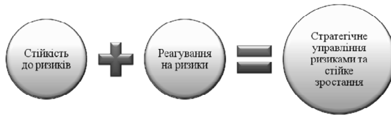
Рис. 1. Значення ризикостійкості та реагування на ризики в діяльності підприємства

няття, як вигода є майже ключовим у причинно-детермінаційному комплексі виникнення ризиків, оскільки вигода одного учасника ринкових відносин може стати руйнівною силою виникнення ризику, збитків, втрат і навіть банкрутства для інших учасників.