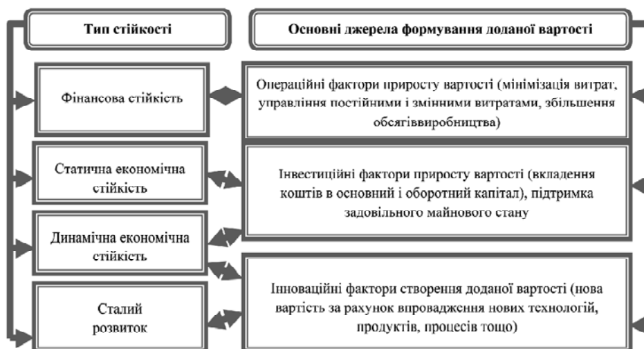
Рис. 2. Співвідношення видів економічної стійкості підприємства та основних джерел формування доданої вартості

Необхідно зазначити, що кожному виду економічної стійкості підприємства можна поставити у відповідність конкретні джерела приросту доданої вартості. Так, для підприємств, що характеризуються короткостроковою чи довгостроковою фінансовою стійкістю, ними є операційні чинники — оптимізація витрат, збільшення обсягів виробництва тощо. Для статичної економічної стійкості основним джерелом створення доданої вартості є інвестиції в