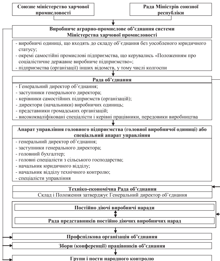
Рис. 1. Схема управління виробничим аграрно-промисловим об'єднанням системи Міністерства харчової промисловості*