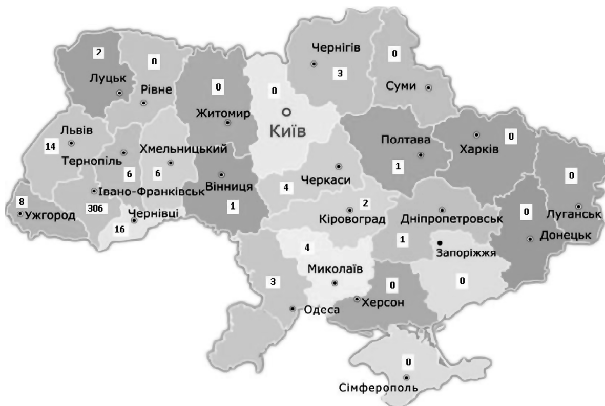
Рис. 3. Геопросторове розміщення садіб сільського зеленого туризму в Україні у 2017 році