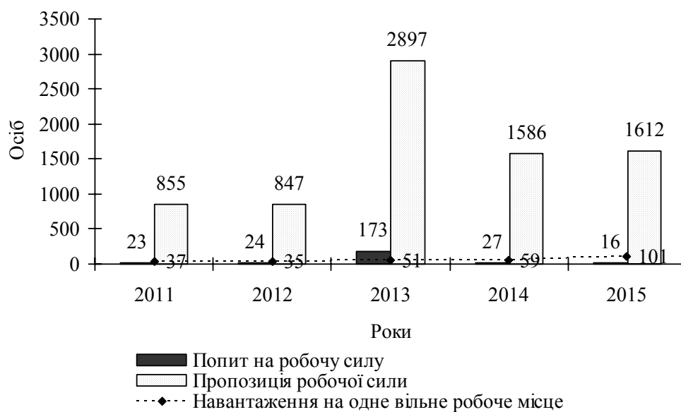
Рис. 2. Стан ринку аграрної праці Полтавської області з формування попиту і пропозиції на кваліфіковану робочу силу у 2011—2015 рр.